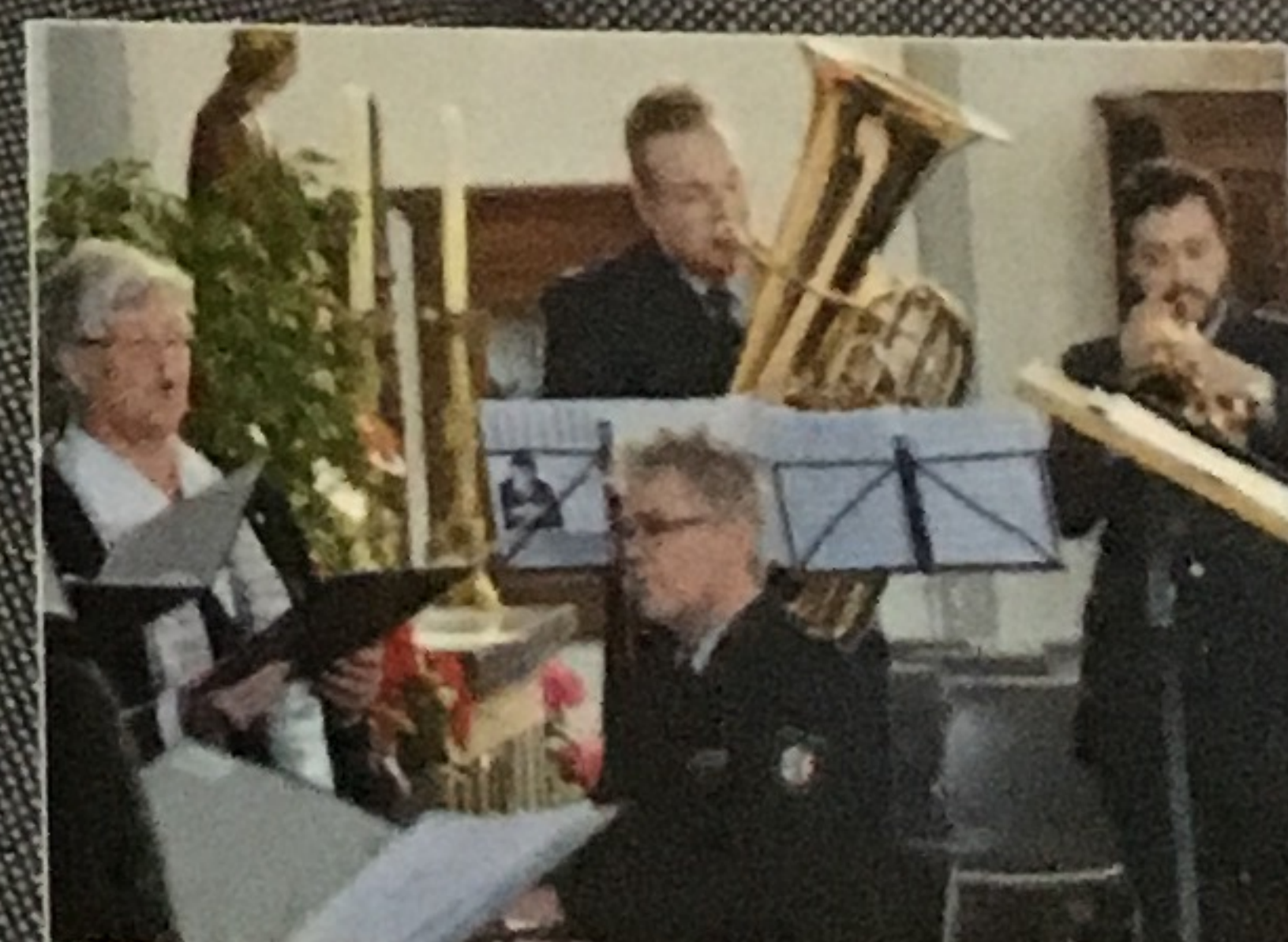
DIENST OHNE BLAULICHT DAS LANDESPOLIZEIORCHESTER