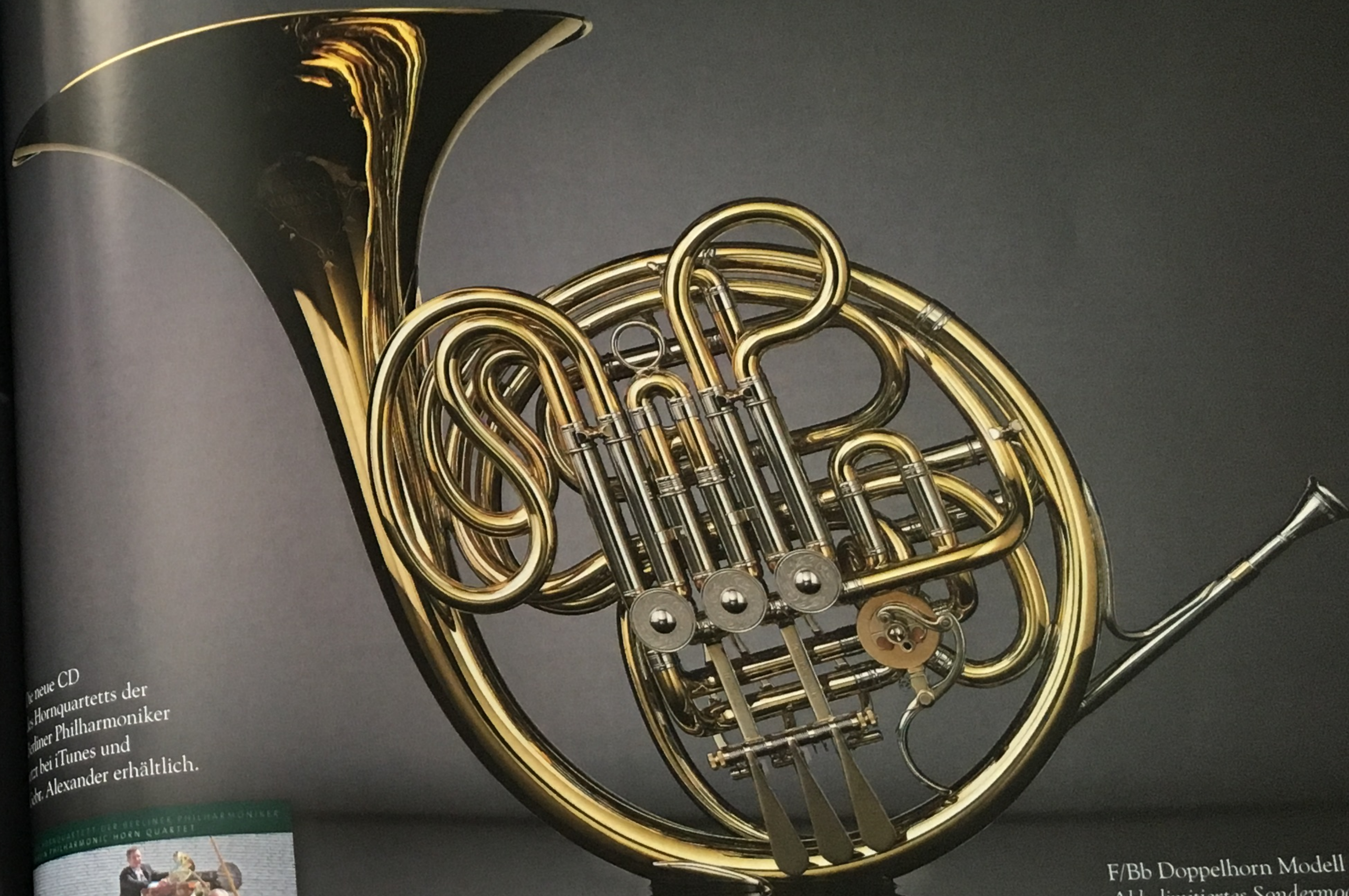
F/Bb Doppelhorn Modell 1 Abb. limitiertes Sondermodell zum 100jährigen Jubiläum des patentierten Instrumenten

Metallblasinstrumente von Gebr. Alexander Legendärer Klang von Hand gefertigt seit 1782