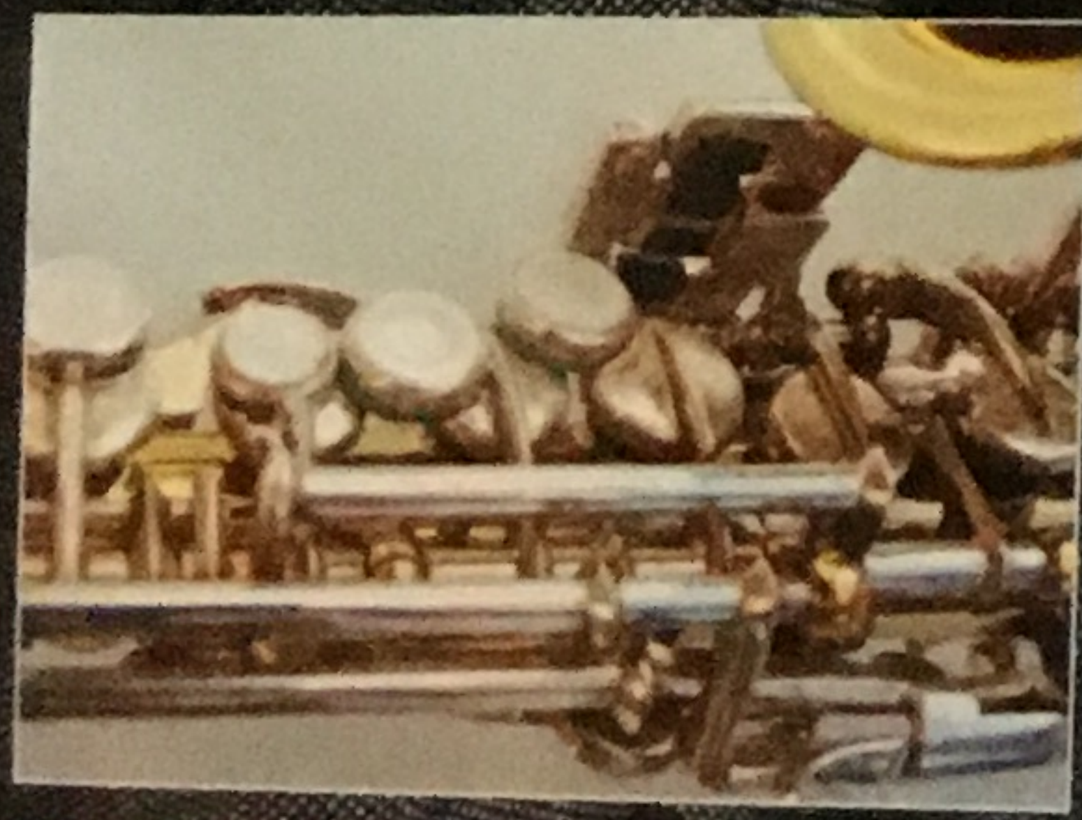
VINTAGE WOOD ORSI SOPRANINO SAX