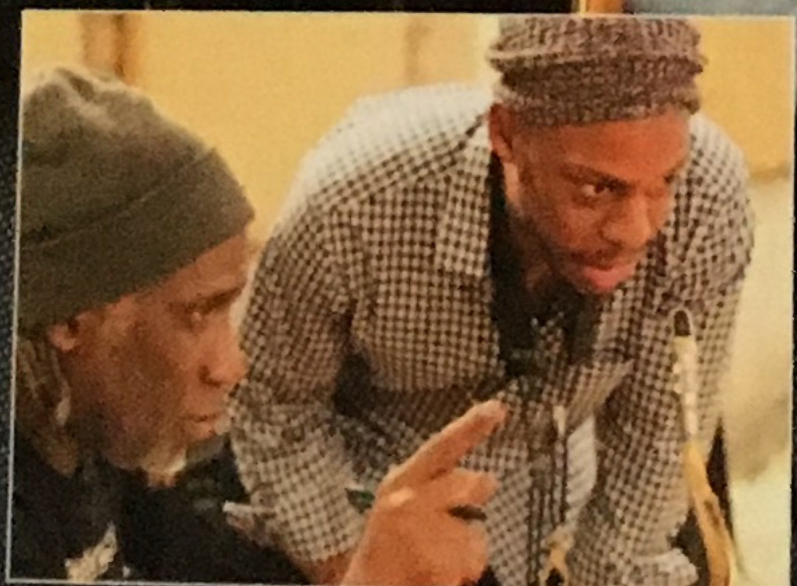
NEU BEI BLUE NOTE MARCUS STRICKLAND